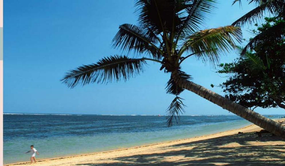
Het strand bij Sanur strekt zich uit over vele kilometers

► Dit symbool verwijst naar de uitneembare kaart