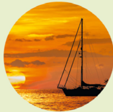
De walvis- en dolfijnenjacht gebeurt in de wateren rond La Palma tegenwoordig zonder bloedvergieten.

De griend gaat alleen op jacht, maar daarbuiten leeft hij in een groep die een leider, de piloot, volgt. Deze zeezoogdieren kunnen met elkaar communiceren met akoestische signalen: een repertoire van klanken dat per minuut tientallen keren herhaald kan worden. Onderzoek heeft laten zien dat ieder dier zijn eigen signaal bezit, dat de functie van een naam heeft. Die naam dient ter communicatie, om in troebel water of over grote afstanden in contact te blijven.