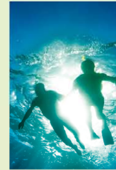
Snorkelparadijs Playa de la Veta.

Tot slot staat een bezoek aan een eenzaam zandstrand op het programma, gewoonlijk het Playa de la Veta 3 , waar het heerlijk zwemmen en snorkelen is.