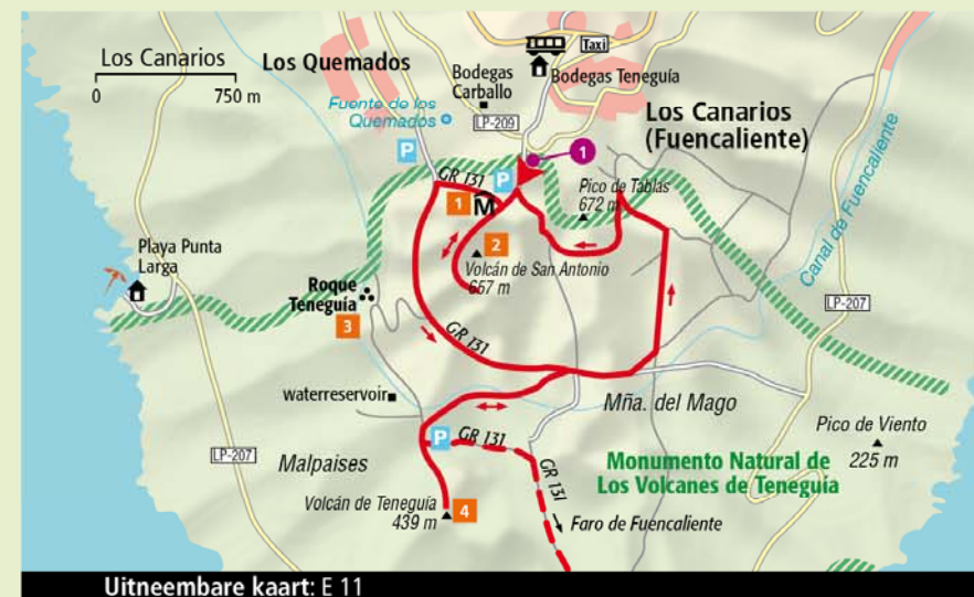
Uitneembare kaart: E 11

Op weg naar het bezoekerscentrum: links van de weg kun je in het rustieke Casa del Volcán 1 Canarische gerechten bestellen en er wijn van de bodega bij drinken (Calle Los Volcanes 23, tel. 922 44 44 27, www.lacasadelvolcan.es, di.-zo. vanaf 12.30 uur, menu vanaf € 13,50).