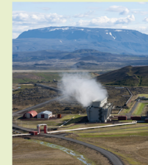
De Krafla-centrale met op de achtergrond de tafelberg Búrfell

Vooral in gebieden met actief vulkanisme of andere geothermische verschijnselen moet je goed opletten waar je loopt. Blijf binnen de touwen en op de paden!