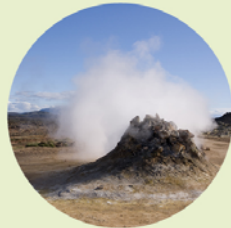
De met veel kabaal stoom blazende sulfatoren van Námaskarð zijn indrukwekkend.

Mývatn leent zich voor een wat langer verblijf, zodat je dit fascinerende gebied te voet kunt verkennen. Zo kom je veel nauwer in aanraking met het landschap en doe je indrukken op die bij een terloops bezoek met de auto voor je verborgen blijven. Hier wordt een lange wandeling beschreven door een vulkanisch gebied, met sulfatoren, zwavelvelden, lavavelden en actieve vulkanen.