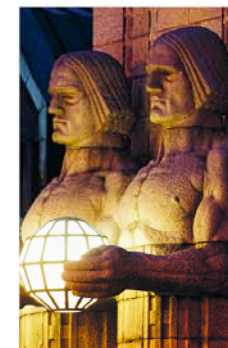
De twee granieten reuzen van het Centraal Station kijken grimmig voor zich uit. Met hun keiharde spieren doen ze wat ze moeten doen: de lichtbollen vasthouden die het station verlichten.

Ten zuiden van de Kaivokatu wordt het plein voornamelijk omringd door hoge gebouwen van grijs graniet, met daarachter de gevels van kantoren, businesscenters en een parkeergarage. Ook zie je er hotels, zoals Seurahuone 1 (► blz. 88), dat hier al sinds 1913 gasten ontvangt. Werp vanaf het trottoir even een blik in het hotelrestaurant, vooral als het 's avonds verlicht is – je zult in Helsinki niet gauw een fraaier ingerichte eetzaal vinden. Verder naar het oosten, maar nog steeds aan de zuidzijde, wordt de aandacht getrokken door de Nationale Galerie Ateneum 3 (Ateneumin taidemuseo). Het enkele jaren geleden gerestaureerde, paleisachtige pand uit 1887 geeft met de busten van Bramante, Phidias en Rafaël al aan dat het aan de kunst gewijd is. Ook vanbinnen is het gebouw indrukwekkend; hier is de grootste kunstcollectie van het land ondergebracht, met in het bijzonder Finse werken van na