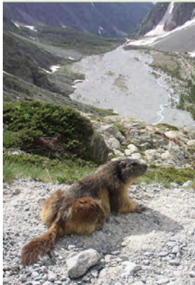
Verrassingen genoeg onderweg naar de witte gletsjer: een alpenmarmot waakt over zijn territorium.

In de 12e eeuw verzette Pierre Valdo, een handelaar uit Lyon, zich tegen de rijkdom en corruptie van de geestelijkheid en gaf zijn bezittingen aan de armen. De katholieke kerk bestempelde zijn aanhangers, die de Valdois werden genoemd, al gauw als een ketterse sekte. Om aan vervolging te ontkomen, verborgen zij zich in de afgelegen valleien rond Vallouise en Argentières. In de 15e eeuw belandden veel Valdois op de brandstapel, maar het duurde tot in de 18e eeuw