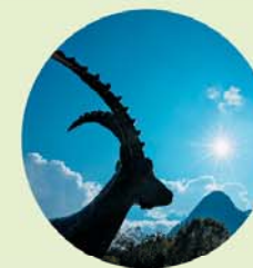
Zlatorog – 'Goudhoorn' aan het Jasnameer.

Wie zin heeft in een beetje avontuur, gaat bij de volgende bocht, de 49e, naar rechts en volgt de 1,3 km lange zijweg naar een hut (Koča pri izviri Soče). Hier moet de auto worden geparkeerd. Over een steil, gemarkeerd bospad klim je naar een plateau en dan gaat het verder langs een met staalkabels beveiligde rots. Na vijftien minuten sta je plotseling voor de Sočabron 6 (Izvir Soče): krachtig komt de beek uit een smalle rotsspleet tevoorschijn om zich vervolgens als een waterval met oorverdovend geraas in een met kristalhelder water gevuld bekken te storten!