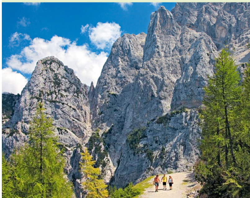
Een wereld van gneis en graniet – wandelen bij de Vršičpas.

Alleen al de rit omhoog naar de 1611 m hoge Vršičpas is een belevenis! Vanuit Kranjska Gora 1 kronkelt de omstreeks 1916 aangelegde alpenweg in 25 haarspeldbochten (stijgingspercentage 14%!) naar de pas, daarna gaat het langs even