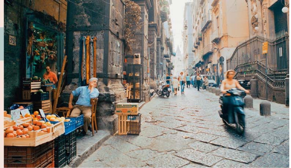
In het hart van Napels – op de Via dei Tribunali

► Dit symbool verwijst naar de uitneembare kaart