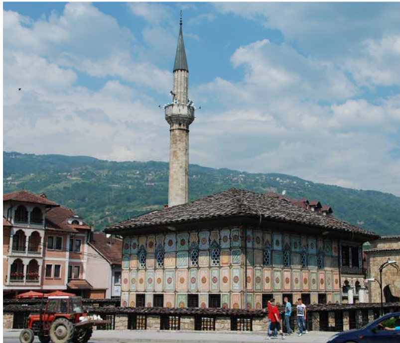
De Pashamoskee, ofwel 'de gekleurde moskee', in Tetovo.

Volkašin, de vader van koning Marko, begon met de bouw van een klooster bij het dorpje Markova Sušica, op de hellingen van het Torbešija-gebergte, ten zuiden van de Vodno. In 1371 sneuvelde Volkašin echter in de strijd tegen de Ottomanen. Marko zelf zorgde er toen voor dat het klooster, dat nu Marko-klooster (D 3) wordt genoemd, voltooid werd. Op de zuidelijke muur van de kloosterkerk, die is gewijd aan de heilige Demetrius, zijn vader en zoon afgebeeld. Ook Marko zou later het leven laten in een gevecht tegen de Ottomaanse vijand, in zijn geval bij Rovine (Roemenië). Aan de slag die daar in 1395 plaatsvond, dankt de Demetriuskerk een belangrijke schenking van vijf schitterende iconen. Het gaat om Christus Pantocrator, Moeder Gods Hodegetria, Johannes de Voorloper, aartsengel Michaël en de heilige Demetrius.