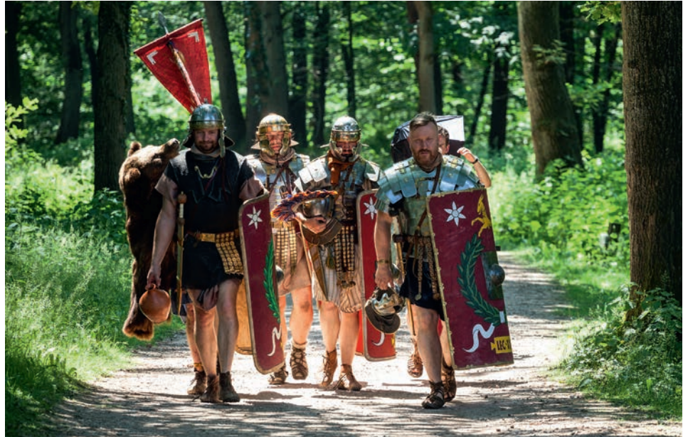
Tijdens een dagmars kon de uitrusting van een Romeinse soldaat meer dan 30 kilo wegen

Rond het jaar 50 v.Chr. slaagt Gaius Julius Caesar erin heel Gallië te veroveren. Het gebied beslaat niet alleen Frankrijk, maar ook België en delen van Zwitserland, Duitsland en Nederland. Voor Caesar's opvolger, keizer Augustus, is dat nog niet genoeg. Hij wil ook het noordelijker gelegen Germania inlijven. Ruim dertig jaar later trekt zijn stiefzoon Drusus met een enorm leger naar de Rijndelta en bouwt een groot legerkamp op de Hunnerberg bij Nijmegen. Van hieruit weet hij de volkeren ten noorden van de Rijn zonder veel moeite te onderwerpen. Maar dan stopt de oorlogsmachine.