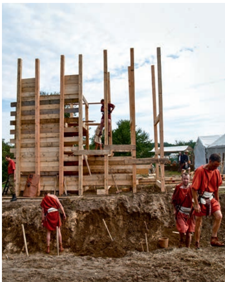
De Romeinen bouwden hun forten zelf

In 9 n.Chr. leiden de Romeinen in het Teutoburgerwoud, net over de grens bij Oldenzaal, zelfs een vernietigende nederlaag. Drie legioenen plus hulptroepen, in totaal zo'n 20.000 man, worden door de Germanen op brute wijze afgeslacht. De Romeinen ondernemen verschillende strafexpedities, maar het lukt