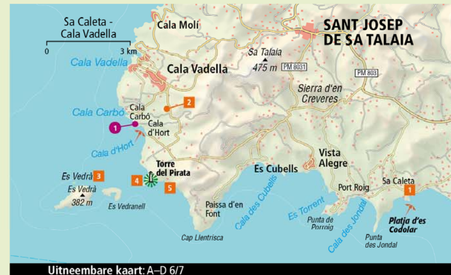
Uitneembare kaart: A-D 6/7

El Boldado 1 : tegenover Ses Païsses aan de weg omlaag, tel. 626 49 45 37, di.-zo. (voorjaar en herfst dag.) 13.30-23.30 uur, hoofdgerechten € 10-15.