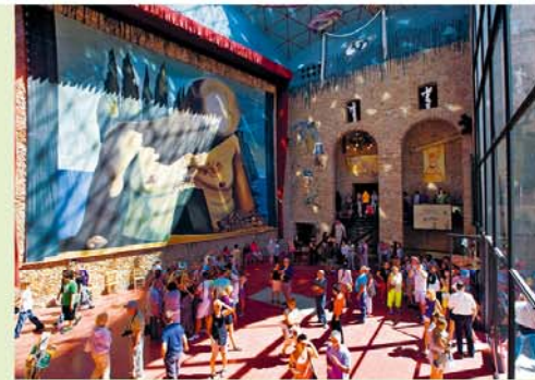
In het toepasselijke decor van een voormalig theater wordt de kunst als spektakel geënceneerd – en de museumbezoekers spelen daarbij hun eigen bescheiden rol.

Meer zien van de beroemde surrealist? Bezoek dan niet alleen het Teatro-Museu in Figueres en het Casa-Museu in Cadaqués-Portlligat (► blz. 31), maar ook het 38 km ten zuiden van Figueres gelegen Castell Gala Dalí (📍 E-F 7, Plaça Gala Dalí, Púbol-la-Pera, tel. 972 48 86 55, www.salvador-dali.org , half mrt.-half juni, half sept.-okt. di.-zo. 10-18, half juni-half sept. di.-zo. 10-20, nov.-6. jan. di.-zo. 10-17 uur, € 8/6). Dalí kocht het kasteeltje in 1970 voor Gala en richtte het in met een bizarre mix van wandtapijten, meubels en kunst.