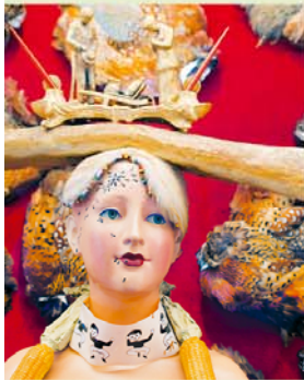
Bij Dalí vervaagt de grenslijn tussen kunst en kitsch.

Wat is een 'grillige kust' zonder een grillige kunstenaar als Dalí? Hij liet zich niet alleen inspireren door het landschap, hij herschiep ook zijn geboortestad en bouwde hier een ultieme kunsttempel in de vorm van het Teatre-Museu.