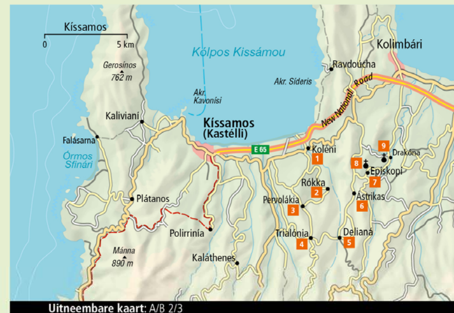
Uitneembare kaart: A/B 2/3