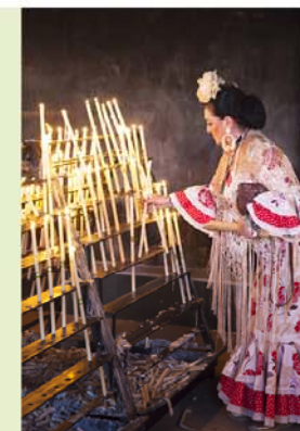
Pelgrim in El Rocío.

Inzet van alle drukte is La Virgen del Rocío , het beeld van de Maagd in de kerk, dat beter bekend staat als Blanca Paloma. Voor het krieken van de (Pinkstermaan)dag klimmen stoere mannen over het hek in de kerk. De eerste zonnestraal van de dag moet op de 'Witte Duif' kunnen vallen. Dan wordt het beeld langs alle broederschappen gereden. In een zinderende menigte worden over-sentimentele (en/of dronken) mannen hardhandig aan de kant gezet om de heftig aanbeden Maagd zonder vallen door de haag opgezweepte feestvierders te kunnen torsen.