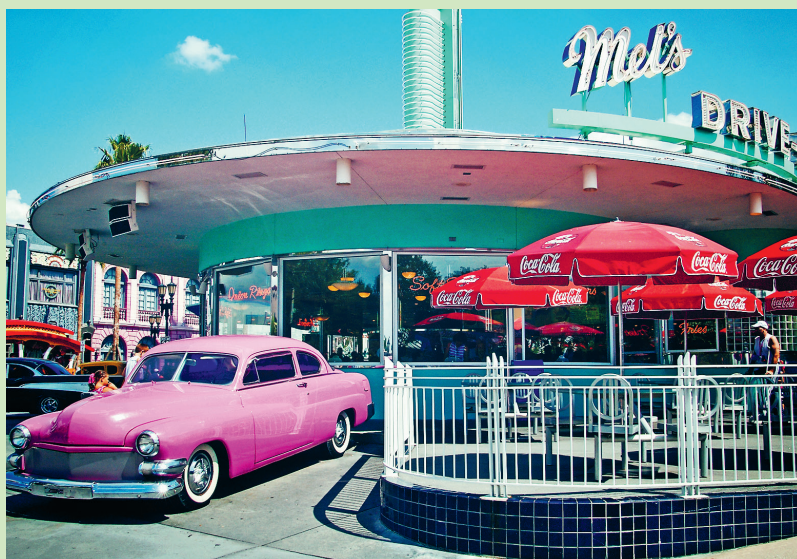
Karakteristieke diner uit de jaren 50 in de Universal Studios in Orlando

Staten niet gebruikelijk dat de gasten zelf een tafel uitzoeken. Wel kunt u – wanneer u naar een tafel wordt gebracht – natuurlijk uw voorkeuren kenbaar maken (bijvoorbeeld dat u het liefst bij het raam wilt zitten).