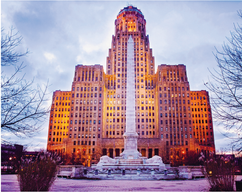
City Hall in Buffalo met het monument voor de vermoorde president McKinley