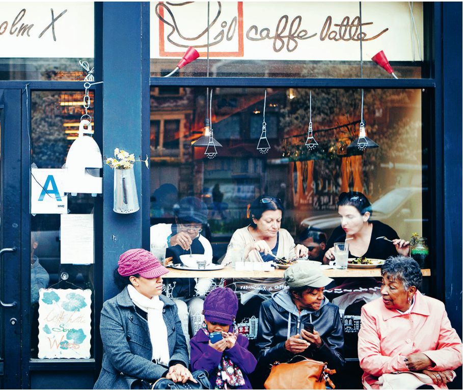
Ook Malcolm X heeft hier in de New Yorkse wijk Harlem wellicht koffie gedronken

Pennsylvania met 12,8 miljoen inwoners. In tegenstelling hiermee wonen in staten als Maine en Vermont maar 1,3 miljoen respectievelijk 626.000 mensen. De grootste toestroom tussen 2000 en 2014 is in New York City, Atlanta en Centraal-Florida geregistreerd; in de staten New York, Ohio en Pennsylvania stagneerde de bevolkingsgroei.