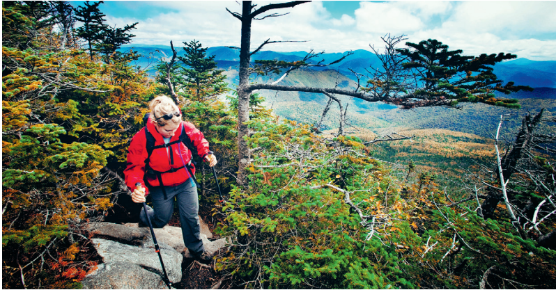
Uitzicht vanaf de Franconia Ridge Trail in New Hampshire over de White Mountains

water en zijn in de kustvlakte bevaarbaar. Ze zijn tevens verantwoordelijk voor de watertoevoer aan de steden en voor de irrigatie van landbouwgronden. Alleen al in Maine hebben gletsjers uit de ijstijd 2200 meren achtergelaten. Tot de indrukwekkendste getuigen uit deze periode behoren de vijf Grote Meren: Lake Ontario, Lake Erie, Lake Huron, Lake Michigan en Lake Superior aan en over de grens met Canada, het grootste zoetwaterreservoir op aarde. Waar Lake Ontario en Lake Erie samenkomen, liggen de Niagara Falls, een van de grootste natuurwonderen van de oostelijke Verenigde Staten.