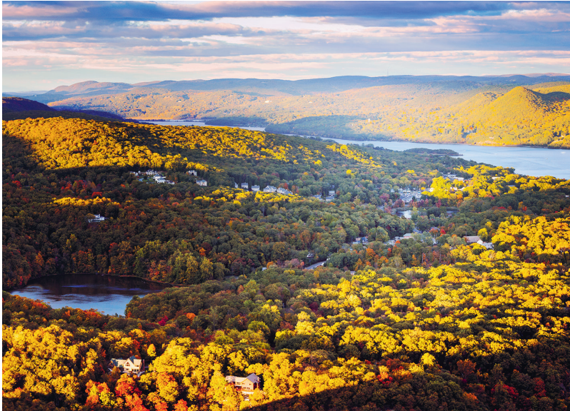
Voor de deur van New York City: de Hudson Valley

Brotherhood Winery in Washingtonville, die in 1837 voor het eerst voor commerciële doeleinden miswijn produceerde ( www.hudsonvalleywinecountry.org ).