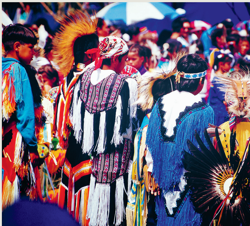
Veel van de kostuums van de powwow zijn van generatie op generatie overgegeven

op de kostuums van de Grass Dancers kunnen zo worden bewogen dat ze doen denken aan het gras van de prairie dat wuift in de wind. Deze dansers hadden destijds tot taak het gras voor de volgende dans alvast plat te maken.