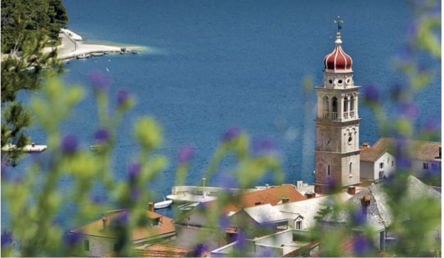
Pučišća op het Midden-Dalmatische eiland Brač