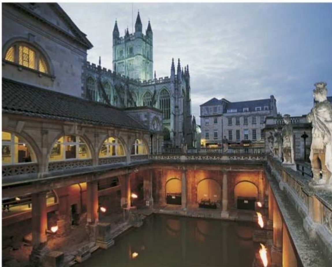
Tegenwoordig onder de blote hemel: het grote bassin van de Romeinse baden van Bath

Bath kwam een einde toen kroonprins George de voorkeur gaf aan Brighton dat zo Bath naar de kroon stak.