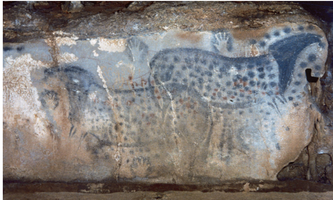
Schilderingen van paarden in de grot van Pech Merle, ca. 15.000 v.C.

Dit knutselidee is geïnspireerd op grotschilderingen die duizenden jaren geleden werden gemaakt in de grot van Pech Merle in Frankrijk. De kunstenaars gebruikten pijpjes van bot om pigment op de grotwanden te blazen. Met hun handen maakten ze afdrukken.