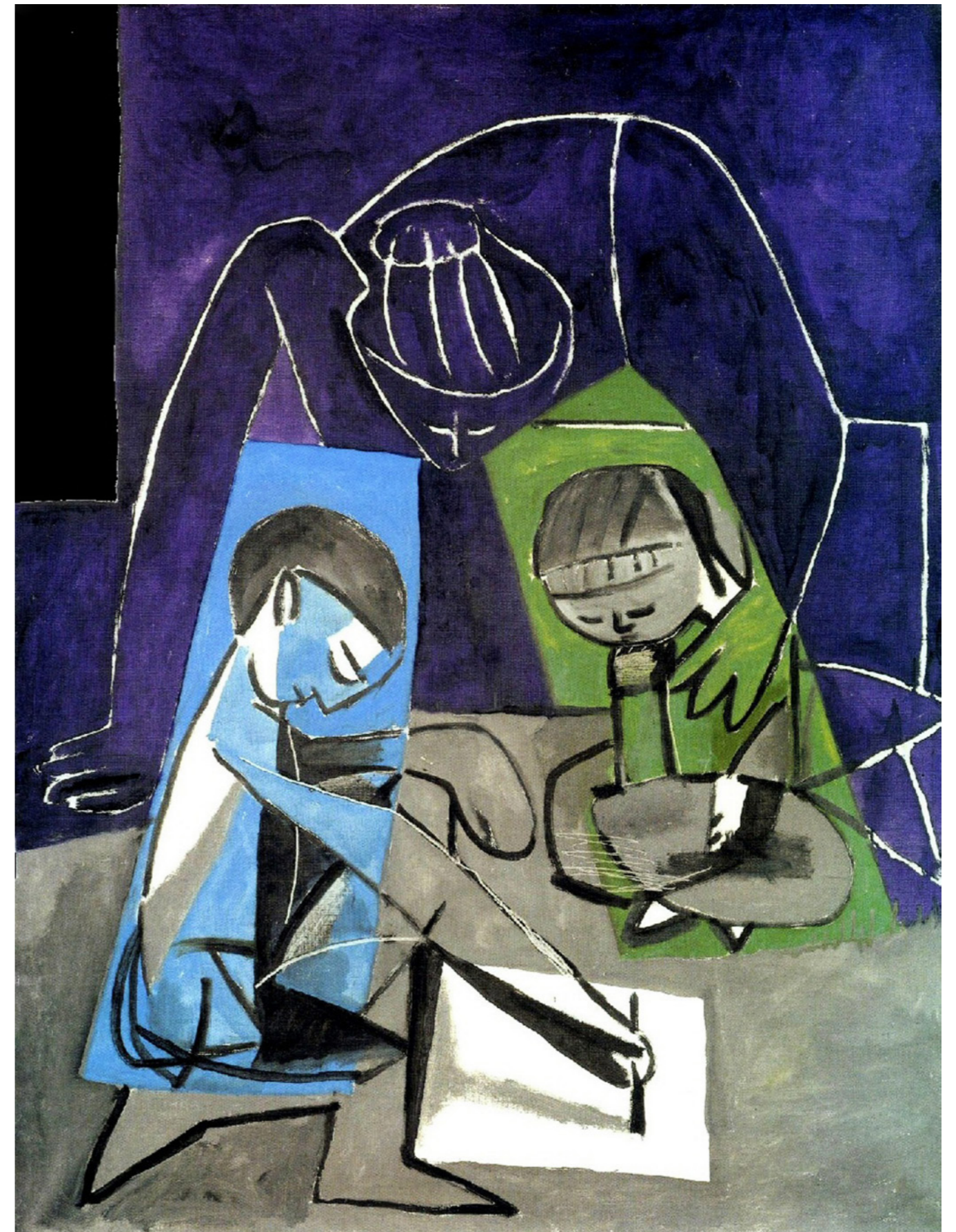
Pablo Picasso, Claude Dessinant, Françoise et Paloma , 1950