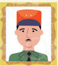
CHARLES DE GAULLE 1890-1970

Legerofficier de Gaulle leidde het Franse verzet tijdens WO II en werd de eerste president in een nieuw tijdperk in de Franse geschiedenis.