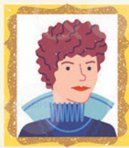
SARAH BERNHARDT 1844-1923

Legerofficier de Gaulle leidde het Franse verzet tijdens WO II en werd de eerste president in een nieuw tijdperk in de Franse geschiedenis.