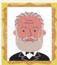
VICTOR HUGO 1802-1885

Dit boerenmeisje dat krijger werd, inspireerde de Fransen om te vechten tegen de Engelse invasie tijdens de Honderdjarige Oorlog.