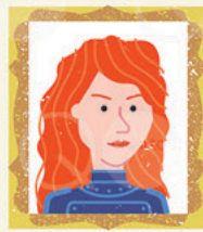
JEANNE D'ARC CA. 1412-1431

Dit boerenmeisje dat krijger werd, inspireerde de Fransen om te vechten tegen de Engelse invasie tijdens de Honderdjarige Oorlog.