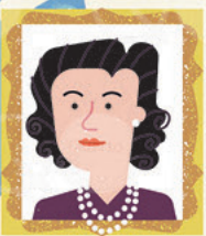
COCO CHANEL 1883-1971

Een modeontwerpster, ze stichtte en leidde een van de beroemdste luxemerken ter wereld.