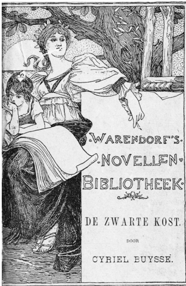
Voorplat van de eerste druk van De Zwarte Kost uit 1898.