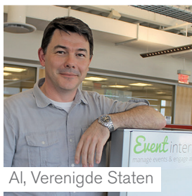
Al, Verenigde Staten