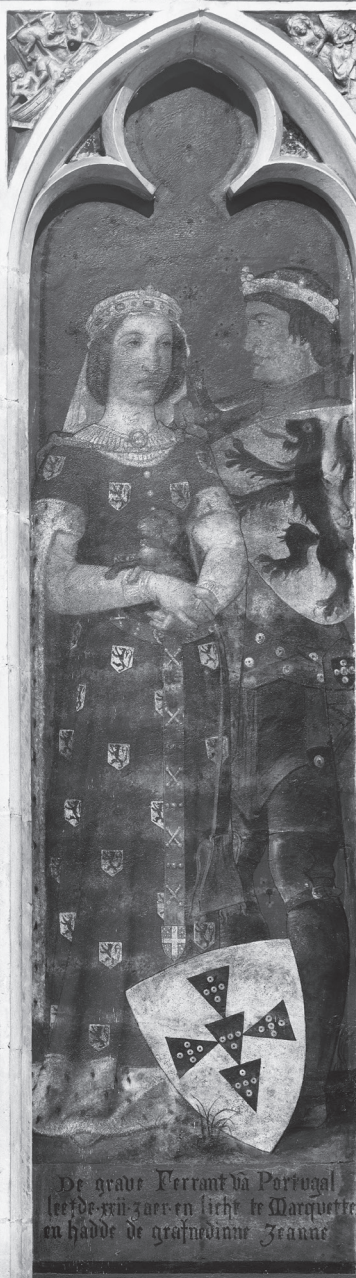
De grave Ferrant va Portugal leefde xii jaar en sichte te Marquette en hadde de grafmedinne Jeane