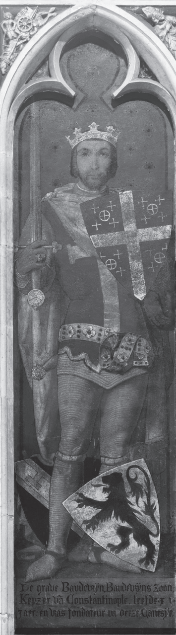
De grave Baudouyn/Baudouyns zoon. Keyzer va Constantinople leefde 11 jaar en was fondateur va dezer Ganesj's