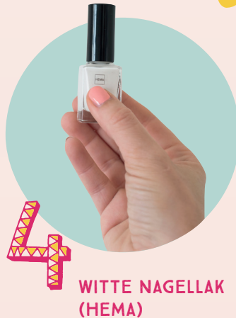
WITTE NAGELLAK (HEMA)

Een must have als je wilt uitpakken met je nail art, want verzorgde handen zorgen nu eenmaal voor een picture perfect! Mijn favoriet: deze intensief voedende en plantaardige handcrème van Cime, eentje waar je handen nadien niet van klevan. Pfiew!