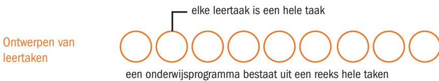
TABEL 2.1 Ontwerpprincipes voor leertaken