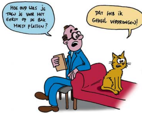
Therapiesetting bij Freud

Hij ontwikkelt een gesprekstherapie waarbij niet de therapeut, maar de cliënt zelf het therapeutische proces richting geeft. De therapeut zit niet achter de cliënt op de sofa zoals Freud, maar zit tegenover hem of haar. Hij stelt de subjectieve wereld van de cliënt centraal.