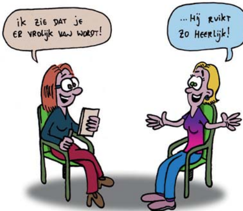
De setting bij Rogers

Rogers ontwikkelde ook belangrijke inzichten voor onderwijs en training. Humanistisch psychologen zijn het niet eens met het psychoanalytisch uitgangspunt dat de mens geregeerd wordt door instincten en drijfveren. Ook vinden ze dat Freud ongelijk heeft als hij stelt dat de eerste zes jeugdyears allesbepalend zijn en dat daarmee alles gedetermineerd is. Zij vinden dat verdere groei in de volwassenheid mogelijk is en dat je je vrij kunt maken van beperkende invloeden. Humanistisch psychologen hebben een positieve kijk op de aard van mensen. Zij zien bij de pasgeborene een natuurlijke aanleg om dingen te willen leren tot aan de grenzen van zijn mogelijkheden. De termen zelfontplooiing of zelfactualisatie horen bij de humanistische psychologie. Maar pas op: humanistische psychologie baseert zich niet op het humanisme.