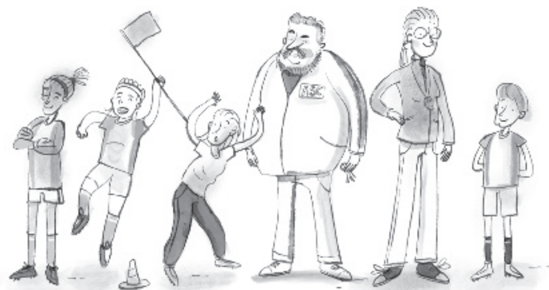
Fara Jewel hies Guus Octaaf Carmen Daan