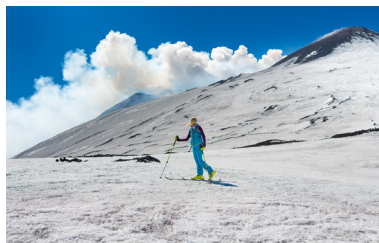
↑ Een skiër komt op adem op de winterse ijs-hellingen onder de top van de vulkaan