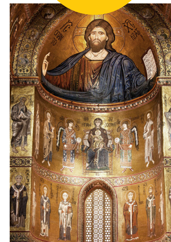
↑ Het enorme mozaïek van Christus Pantocrator (12de-13de eeuw)

De kloostergang is een meesterwerk van Normandische kunst.