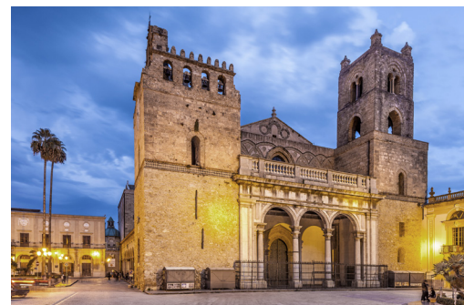
↑ De vestingachtige gevel van de kathedraal van Monreale aan de Piazza Guglielmo

Het interieur van de kathedraal van de Monreale bevat circa 6500m 2 aan briljante mozaïeken.