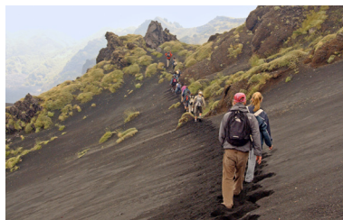
↑ Wandelaars in het zwarte zandlandschap rondom de vulkaan