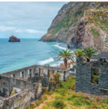
De serene Ruínas de São Jorge

1 Ruínas de São Jorge Vlak bij Praia do Calhau in São Jorge (blz. 53) liggen de resten van een oude suikermolen. De suikerrietindustrie begon op Madeira in de 15de eeuw, en dit was een van de eerste molens op het eiland. Tussen de ruïnes staat een goed bewaard gebleven stenen boog, die het uitzicht op de oceaan omlijst.