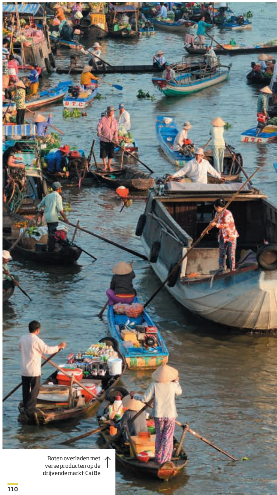
Boten overladen met verse producten op de drijvende markt Cai Be ↑