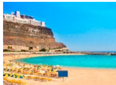
De baai bij Amadores

Op het zonnigste gedeelte van het eiland ligt Playa de Amadores, een breed zandstrand met veel vertier en mogelijkheden om te windsurfen, te duiken en een boottocht te maken. U vindt er ook volop restaurants en cafés. Tijdens een wandeling over de kliffen tussen Amadores en Puerto Rico is het uitzicht adembenemend.