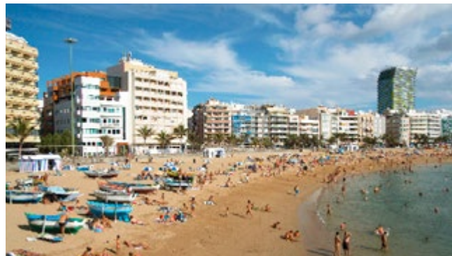
Zonaanbidders op Playa de Las Canteras

Leer hoe bier wordt gemaakt, hoeveel u weegt op Mars en of uw gehoor en hartslag wel normaal is. Dit is een prima plek om een paar uur door te brengen, vooral als u door de regen wordt verrast in Las Palmas in Las Palmas.