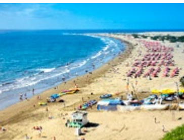
Playa del Inglés is erg populair