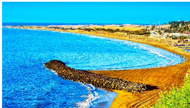
Het strand bij Maspalomas, met daarachter de spectaculaire zandduinen