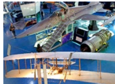
Museo Elder de la Ciencia

ker wordt het meer goud, en gaat de zee, beschermd door het brede rif, lijken op een meer. De lokale bevolking gaat soms naar de el ascensor (de lift), een deel van het rif waar de deining zwemmers op de rotsen gooit – als u niet precies weet waar het is, kijk dan naar de menigte Joelende jongeren voor Playa Chica.