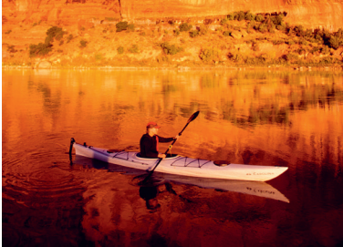
↑ Kajakken op de Colorado River onder de kliffen van het Arches National Park

Het Arches National Park is van maart tot en met oktober zeer druk, en dan met name rondom vrije dagen. Van april tot en met oktober moeten bezoekers behalve een toegangsbewijs voor het park ook een ticket kopen met een tijdslot. Deze tickets zijn drie maanden voor uw bezoek verkrijgbaar via de website ( www.recreation.gov ) en kosten $ 2. Een beperkt aantal kaartjes is op de dag voor uw bezoek te koop (kijk op de website van het park voor meer informatie). Er is bij populaire vertrekpunten slechts beperkte parkeergelegenheid. U kunt dus het best vroeg in de ochtend of laat in de middag komen. De hoogtepunten van het park zijn te zien vanaf de vele uitkijkpunten langs de Arches Scenic Drive. Begin bij het bezoekerscentrum aan het zuidende, bij Hwy 191. Als u tien minuten bij elk uitkijkpunt stopt, hebt u drie uur nodig om de volledige route door het park af te leggen. Vanaf de parkeerplaatsen bij de uitkijpunten beginnen gemakkelijke wandelroutes. De rondwandeling bij Balanced Rock is kort en geschikt voor kinderen. De route is deels geplaveid en toegankelijk voor rolstoelen. Ook het Delicate Arch Viewpoint is een gemakkelijke route. De korte Windows-rondwandeling is