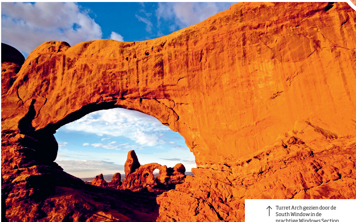
↑ Turret Arch gezien door de South Window in de prachtige Windows Section

fijn voor gezinnen en de eerste 100 m zijn rolstoelgeschikt. Over de bodem van de canyon voert de Park Avenue Trail langs enorme monolieten, waaronder de Courthouse Towers en Nefertiti. Behalve wandelen is ook fietsen een populaire activiteit in het park. Fietsen mag alleen op de aangegeven paden. Diverse organisaties in Moab (blz. 146) bieden mountainbike-excursies. Ook zijn er in het park mogelijkheden om te klimmen; de meeste zijn pittig en alleen geschikt voor mensen met klimervaring. Lokale bedrijven in en om Moab bieden ook jeep-safari's, paardrijtochten, raft- en kajaktrips aan over de rivieren de Colorado en de Green.