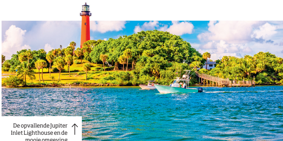
De opvallende Jupiter Inlet Lighthouse en de mooie omgeving ↑

Dit stadje is vooral bekend vanwege de fraaie stranden en de voorjaarstrainingen van de Miami Marlins en de St. Louis Cardinals. Het John D. MacArthur Beach op Singer