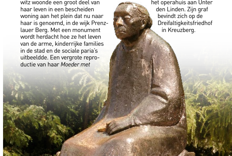
Monument voor beeldhouwster en schilderes Käthe Kollwitz door Gustav Seitz

Deze componist (1809–1847), een kleinzoon van filosoof Moses Mendelssohn, was dirigent van de Staatskapelle (staatskapel) van het operahuis aan Unter den Linden. Zijn graf bevindt zich op de Dreifaltigkeitsfriedhof in Kreuzberg.