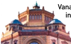
Het rijksversierde Postfuhrant

Vanaf halverwege de 19de eeuw woonden in het Scheunenviertel (schurenwijk) duizenden arme joodse immigranten. Na de oorlog werd de buurt verwaarloosd, waardoor het in verval raakte. De afgelopen decennia kreeg de wijk een opknappbeurt, en zijn veel oude