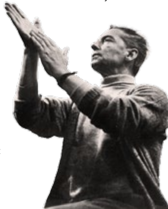
Dirigent Herbert von Karajan

Deze beroemde Oostenrijkse dirigent (1908–1989) stond van 1954 tot 1989 aan het hoofd van de Berliner Philharmoniker. Onder zijn leiding ontwikkelde het orkest een geheel eigen geluid, dat tot op heden geroemd wordt. Herbert von Karajan werd zowel geacht als gevreesd door zijn musici: hij was geniaal, maar ook heetgebakerd. De Berlijners noemen de Philharmonie nog steeds 'Circus Karajani'.