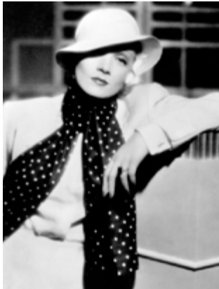
Actrice Marlene Dietrich