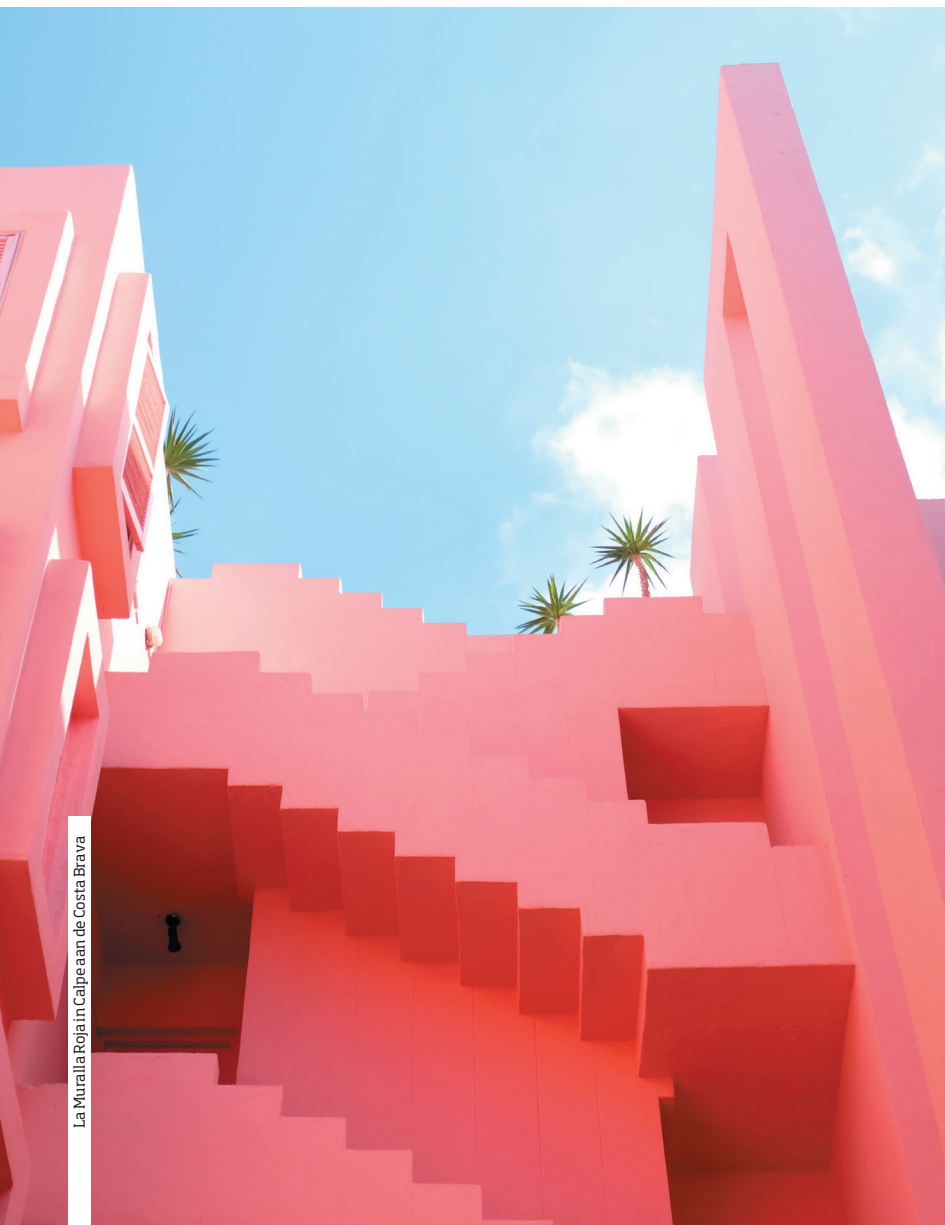
La Muralla Roja in Calpe aan de Costa Brava