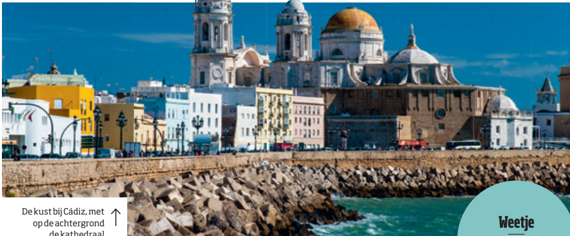
De kust bij Cádiz, met op de achtergrond de kathedraal ↑