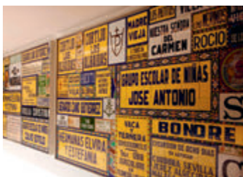
↑ Reclamebordjes gemaakt van azulejos in het Centro Cerámica Triana (blz. 120)

De Moren maakten mooie mozaïeken in ingewikkelde geometrische patronen, als decoratie van hun paleismuren. De gebruikte kleuren waren blauw, groen, zwart, wit en oker.