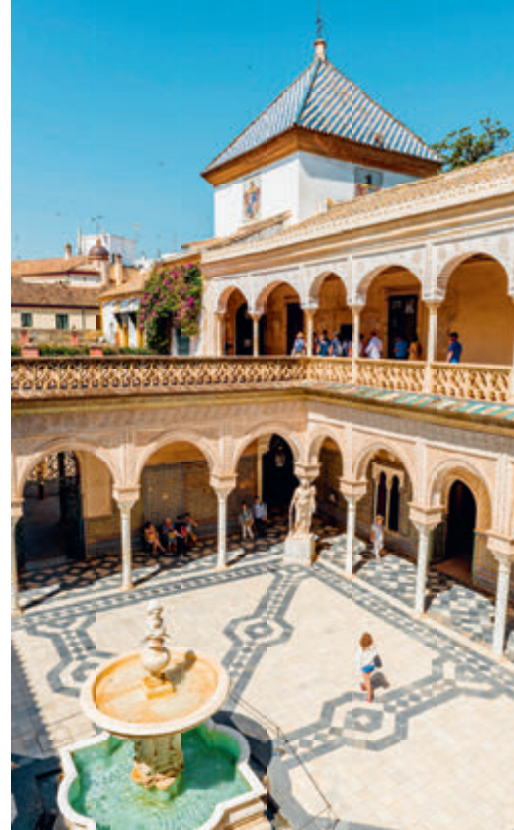
↑ Patio Principal bij Casa de Pilatos, een filmlocatie van David Leans Lawrence of Arabia (1962)

U komt binnen door een marmeren portaal, dat de markies in 1529 in Genua bestelde. Tegenover het met bogen omgeven erf voor koetsen ligt de Patio Principal. Deze binnenplaats is in mudéjarstijl uitgevoerd, versierd met azulejos en fijn stucwerk. Hij wordt omringd door arcaden en bekroond door gotische balustraden. In de hoeken staan drie Romeinse beelden, Minerva, een dansende muze en Ceres, en een vierde beeld, van de Griekse godin Athene uit de 5de eeuw v.C. In het