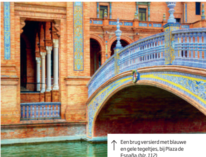
↑ Een brug versierd met blauwe en gele tegeltjes, bij Plaza de España (blz. 112)

Toen de technieken voor het maken en kleuren van azulejos verbeterden, werden ze ook gebruikt voor decoratieve uithangborden en winkelpuien. Zelfs reclames werden in kleurige tegelta-bleaus uitgevoerd. De prachtige resultaten zijn nog in heel Andalusië te zien.