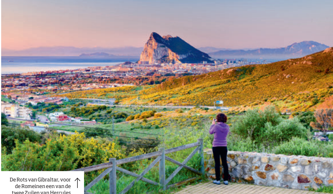
De Rots van Gibraltar, voor de Romeinen een van de twee Zuilen van Hercules ↑