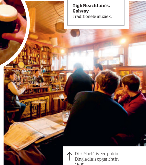
↑ Dick Mack's is een pub in Dingle die is opgericht in 1899

De 'etiquette' in Ierse pubs is informeel, maar het geven van rondjes is wel gebruikelijk. Als u een rondje accepteert, zult u er, om geen scheve gezichten te krijgen, ook een moeten weggeven. Sla een aangeboden drankje op vriendelijke wijze af als u niet te lang wilt blijven plakken.