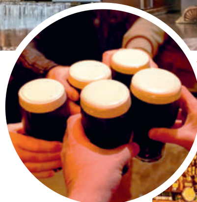
↑ Guinness, het bier met de karakteristieke volle, romige schuimkraag.