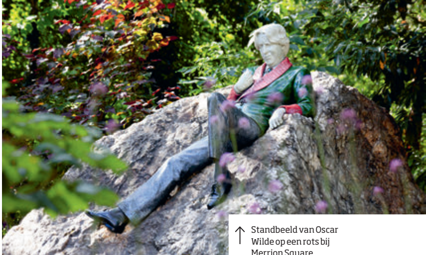
↑ Standbeeld van Oscar Wilde op een rots bij Merrion Square