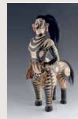
Virgil Ortiz, Centaur . Met dank aan de kunstenaar.