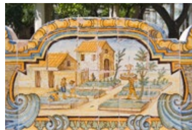
Detail van een tegel, Santa Chiara

Een van de belangrijkste musea voor antieke kunst bezit een paar beroemde beelden uit het Grieks-Romeinse verleden, zoals de Venus Kallipygos, die lange tijd de standaard voor lichamelijke schoonheid is geweest (blz. 18-21). Behalve de marmeren Farnese-Hercules bevat de collectie ook bronzen, mozaïeken, fresco's, geslepen halvedelstenen, glaswerk, Griekse vazen en Egyptische mummies.