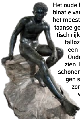
Beeld, Museo Archeologico

Het oude hart van de stad is beroemd om de combinatie van chaos en groot kunstenaarschap, maar het meest om de grenzeloze energie van de Napolitaanse geest. In veel opzichten is het een atavistisch rijk, getekend door het verleden en door talloze rampen, maar het is ook een stad met een besef van het culturele erfgoed, en het Oude Napels laat zich volop aan de wereld zien. De smalle straten zijn veel veiliger en schoner geworden en de verwaarloosde, verborgen schatten zijn hersteld en beter beheerd, zonder dat het unieke levendige gevoel is verdwenen. Spaccanapoli is de gangbare naam van de lange, nauwe straat die loopt van Via Duomo tot Via Monteoliveto. Het is een overblijfsel van een antieke Grieks-Romeinse hoofdstraat.