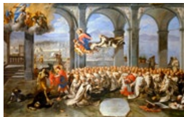
Dankzegging na de pestepidemie