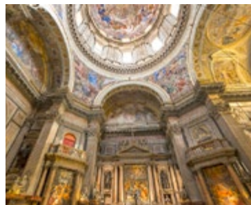
De indrukwekkende Duomo

Het oude hart van de stad is beroemd om de combinatie van chaos en groot kunstenaarschap, maar het meest om de grenzeloze energie van de Napolitaanse geest. In veel opzichten is het een atavistisch rijk, getekend door het verleden en door talloze rampen, maar het is ook een stad met een besef van het culturele erfgoed, en het Oude Napels laat zich volop aan de wereld zien. De smalle straten zijn veel veiliger en schoner geworden en de verwaarloosde, verborgen schatten zijn hersteld en beter beheerd, zonder dat het unieke levendige gevoel is verdwenen. Spaccanapoli is de gangbare naam van de lange, nauwe straat die loopt van Via Duomo tot Via Monteoliveto. Het is een overblijfsel van een antieke Grieks-Romeinse hoofdstraat.