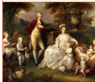
Maria Carolina van Oostenrijk

De huidige linkse burgemeester van Napels zette zich de afgelopen tien jaar in voor tal van hervormingen.