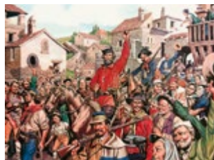
Garibaldi's aankomst in Napels

In 1734 arriveerde de Spaanse koning in Napels. Deze erfgenaam van de Farneseclan, van geboorte Italiaans, transformeerde zijn woonplaats tot een stad van de verlichting.