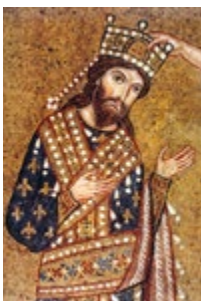
Normandische koning, Rogier II

Na de val van het Romeinse Rijk in de 5de eeuw werd het gebied overspoeld door stammen uit het noorden, vooral door de Goten. In 553 veroverde Belisarius, hoofdgeneraal van de Byzantijnse keizer Justinianus, het gebied.