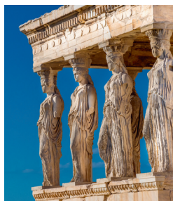
↑ Kariatiden steunen het dak van de veranda van het Erechtheion

Pad van de kaartverkoop naar de Akropolis