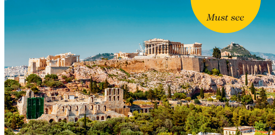
↑ Het Parthenon op de Akropolis ondergaat een restauratie

De beroemdste tempel op de Akropolis, het imposante Parthenon, is gewijd aan de beschermgodin van de stad, Athena (blz. 98).