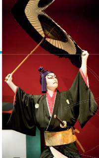
Expositie in het Edo-Tokyo Museum .

Laat u niet afschrikken door de menigtes en drukte van Tokyo. De volgende routes lopen langs de mooiste bezienswaardigheden van deze fascinerende stad. Er is ook genoeg tijd om te winkelen en de heerlijke Tokyo'se lekkernijen te proeven.