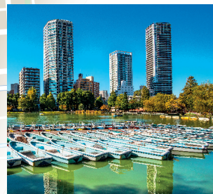
Ueno Park is een groene oase omringd door moderne wolkenkrabbers.

International Forum (blz. 82) en het imposante 20ste-eeuwse Tokyo Station (blz. 76).