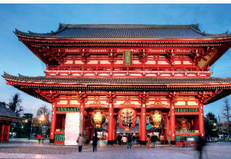
De Senso-ji is van binnen net zo mooi als vanbuiten.