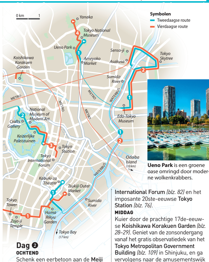
Symbolen — Tweedaagse route — Vierdaagse route

Verken de galeries en musea van Roppongi en ga winkelen in Roppongi Hills (blz. 94) en Tokyo Midtown (blz. 95), waar u ook heerlijk kunt eten of een drankje kunt drinken.