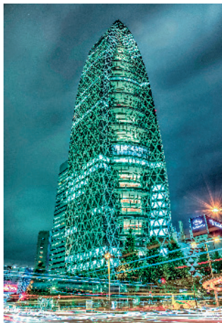
Mode Gakuen Cocoon Tower