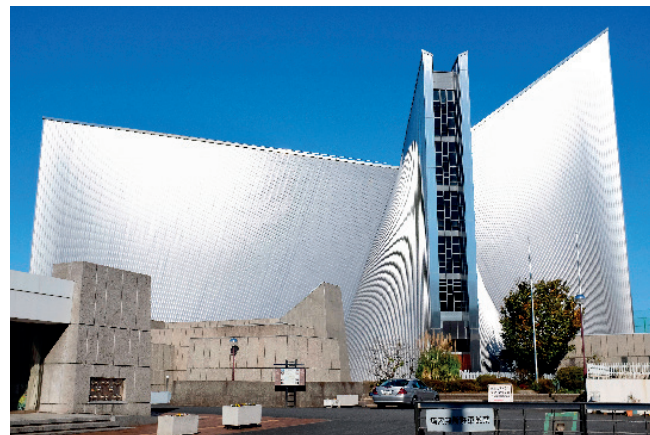
De stijlvolle St. Mary's Cathedral