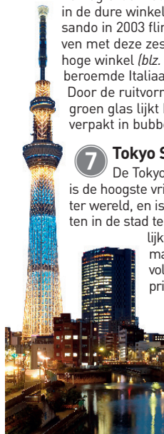
De Tokyo Skytree is al van ver te zien

Tadao Ando's 21_21 Design Site bevindt zich als een ijsberg onder de grond; alleen de twee lage paviljoens zijn deels te zien. De expositieruimten zijn gemaakt van gepolijst beton.