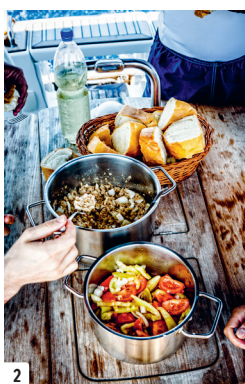
1 Varen bij zonsondergang in Brela, Midden-Dalmatië.