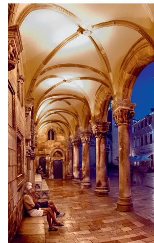
← Zitten onder de mooie bogen van het Rectorspaleis

Dubrovnik was al lang voor de rest van de wereld tegen slavernij – die werd officieel verboden in 1416.