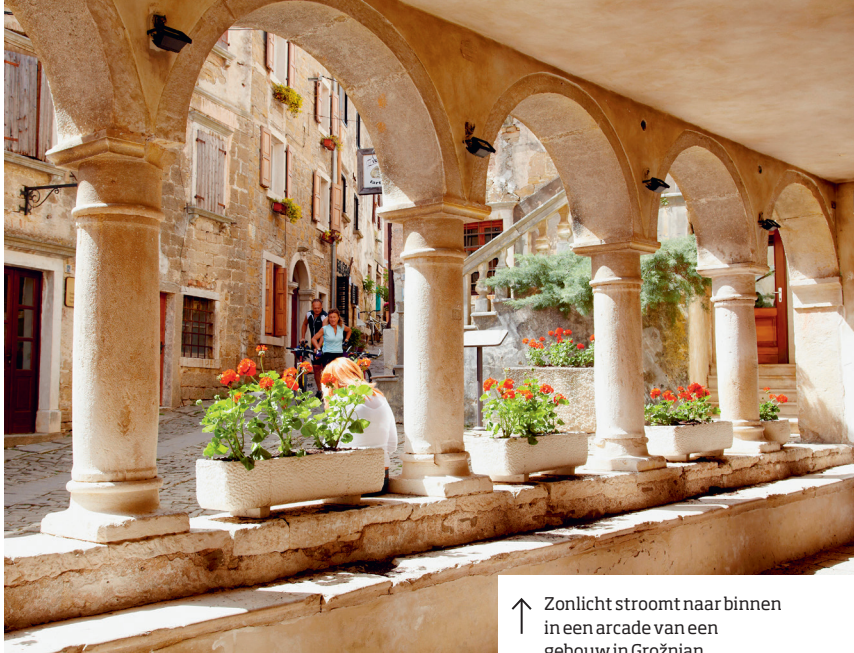
↑ Zonlicht stroomt naar binnen in een arcade van een gebouw in Grožnjan