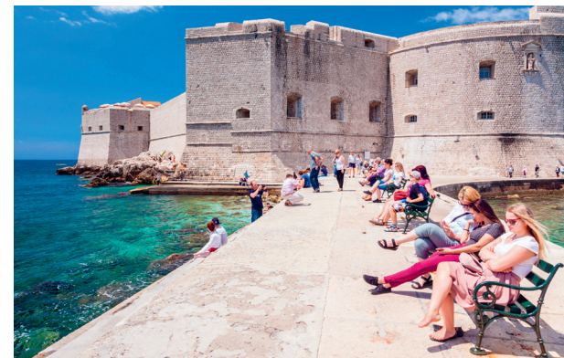
→ Genieten van het uitzicht naast het St. Jansfort

Naast het dominicanenklooster staat de Pločepoort (blz. 67), die naar de haven leidt. Goederen gingen naar en kwamen uit elke haven aan de Middellandse Zee.