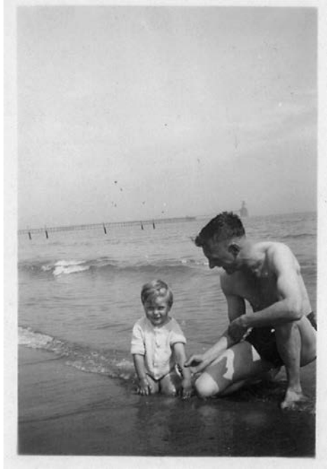
It ain't 'alf cold, dad.*