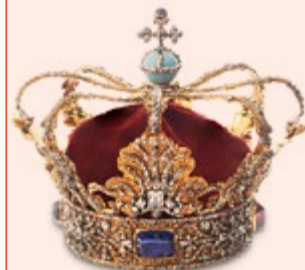
De kroon van Christiaan V

De saffer op de kroon (1670–1671) zou een geschenk zijn van de hertog van Milaan aan Christiaan I in 1474.