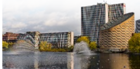
Tycho Brahe Planetarium