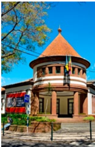
Museu Henrique e Francisco Franco