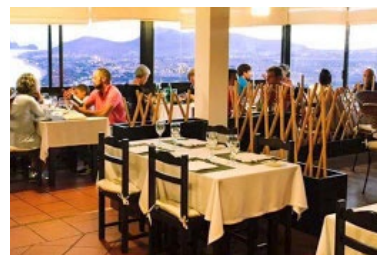
Panorama Restaurant met uitzicht

Met het romantische uitzicht is dine- ren hier een unieke gebeurtenis.