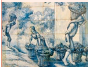
Tegels bij Blandy's Wine Lodge