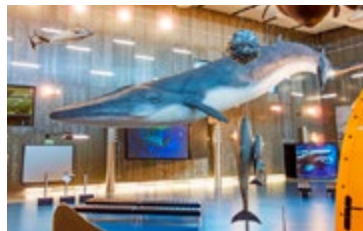
Blauwe vinvis in het Museu da Baleia

Galerie met werk van onder meer Picasso en Francis Bacon.