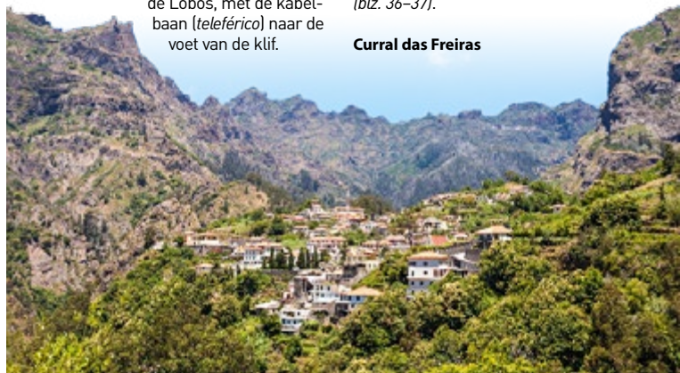
Curral das Freiras

Tegenwoordig verbindt een lange tunnel het valleidorp Curral das Freiras met de wijde wereld, omdat de oude weg uit veiligheids-overwegingen gesloten is. In het dorp krijgt u meteen een idee van hoe geïsoleerd het indertijd lag (blz. 36-37).