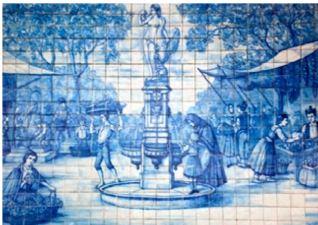
Beschilderde blauwe tegels met Leda en de zwaan