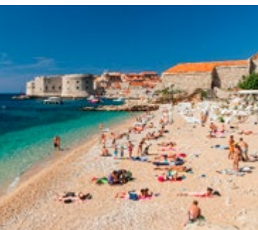
Banje Beach, Dubrovnik

Het zand mag dan geïmporteerd zijn en u moet betalen voor het gedeelte met zonnestoelen, maar het schitterende uitzicht op het oude Dubrovnik en het eiland Lokrum is weergaloos en het water is kristalhelder.