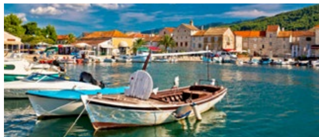
Houten bootjes in de haven van Stari Grad

Veel van de bezienswaardigheden in Dalmatië zijn te vinden op de eilanden. In de historische stadjes zijn sporen van eeuwen cultuur terug te vinden. Moderne toeristenfaciliteiten gaan gepaard met een knusse, gastvrije sfeer. Het landschap op de eilanden is overwegend ruig en niet commercieel, met olijf- en wijngaarden en mediterrane maquis die op stenen muurtjes groeit die eeuwen geleden door boeren zijn aangelegd. De grotere eilanden zijn bekende toeristencentra: het chique, maar charmante Hvar, het zonne-eiland Brač, het met druiven begroeide Korčula en het verre, maar ongerepte Vis, dat bij veel Kroaten favoriet is. Strandliefhebbers zullen genieten van de enorme diversiteit aan kiezelstranden en verscholen baaien en van de kristalheldere zee. Veerboten en catamarans vanuit Split zijn de belangrijkste vervoersmiddelen, maar sommige resorts zijn ook per watervliegtuig te bereiken.