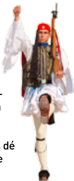
Evzone in traditionele kledij

Aan Plateia Syntagma, het centrum van het moderne Athene, staat het neoklassieke Parlamentsgebouw. De wacht wordt er gehouden door evzones – soldaten die plechtig heen en weer lopen in traditionele korte rokken en schoeisel met pompoms. Bij het Parlement vindt u aan de brede Vasilissis Sofias de 'museum-rij', met tal van musea bij elkaar. Achter Syntagma ligt het chique Kolonáki, waar ambassadeurs, modellen en filmsterren wonen in de buurt van de boetieks die hen van designkleding voorzien. Dit is dé plek om te winkelen, mensen te kijken en in mooie maar dure cafés te zitten. Boven alles uit rijst de Lykavittósheuvel, met op de top het beroemde openluchttheater, leuke cafés en een restaurant.