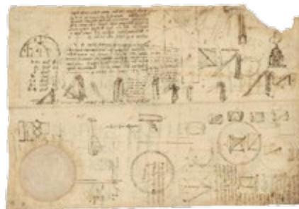
Leonardo da Vinci's schets van Archimedes' schroef

Dit was het geheime wapen van het Byzantijnse Rijk, gebruikt tegen vijandige schepen. Grieks vuur was een zeer ontvlambare, geleachtige substantie, die werd afgevuurd uit bronzen buizen op de voorsteven van Byzantijnse galeien en die niet werd geblust door water. Het werd voor het eerst gebruikt tegen een Arabische vloot die in 673 Constantinopel aanviel en bleef succesvol in de strijd tot de val van het rijk in 1453. Tot op heden kennen wetenschappers nog steeds niet de exacte formule, maar men denkt dat het bestond uit vloeibare petroleum, zwavel, nafta en ongebluste kalk.