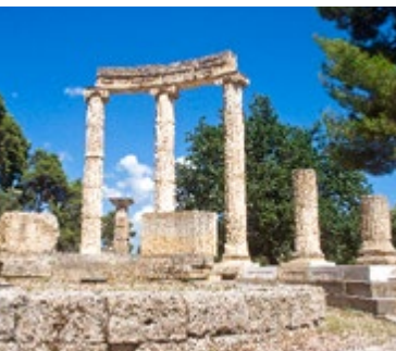
Archeologische site bij Olympia

De eerste bekende spelen werden gehouden op de vlakte van Olympia in 776 v.C. Ze waren gewijd aan Zeus en duurden één dag, met alleen hardlopen en worstelen. In 472 v.C. werd het evenement uitgebreid met boksen, pankration (een vechtsport van man tegen man), paardrijden en de vijfkamp (sprinten, verspringen, speer- en discuswerpen en worstelen), en duurde toen vijf dagen en werd om de vier jaar gehouden.