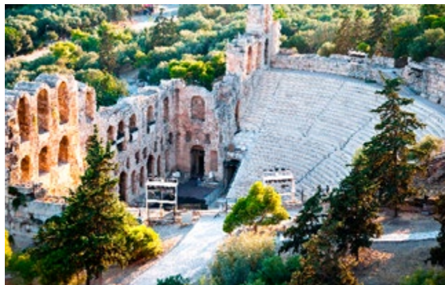
Het Theater van Dyonisus Eleuthereus, Athene

De vroegste vormen van toneel ontstaan uit antieke Griekse heidense rituelen, die uitliepen op een jaarlijkse toneelwedstrijd in de 6de eeuw v.C. ( blz. 42 ). Opvoeringen waren bij daglicht in daarvoor gebouwde amfitheaters en acteurs droegen allerlei maskers voor verschillende rollen. De oudste stukken gaan over waarden als Griekse vaderlandsliefde, eerbied voor de goden, vrijheid en gastvrijheid.