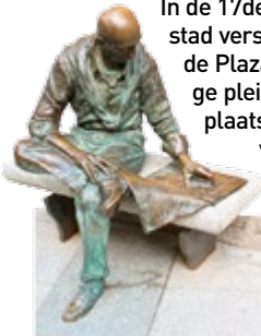
Beeld, Plaza de la Paja

In de 17de eeuw werd de kern van de snelgroeïende stad verschoven van het middeleeuwse centrum, rond de Plaza de la Paja, naar de Plaza Mayor. Dit prachtige plein was behalve een markt- en ontmoetingsplaats vooral het middelpunt van vertier en vermaak. Na verloop van tijd raakten de huizen in verval en werden het goedkope huurhuizen. In de wijken ten zuiden van de Plaza Mayor woonden de arbeiders. Behalve slachthuiswerkers en leerlooiers van het Rastro zag men hier marktkooplui, bouwvakkers, herbergiers, paardenhandelaren, en zelfs criminelen.