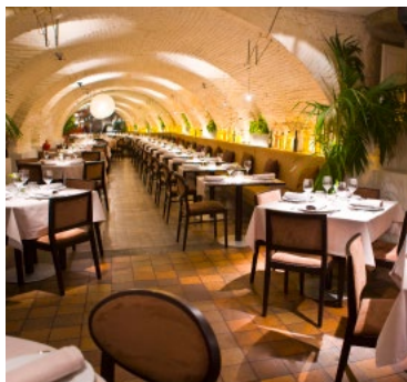
De gewelfde ruimte van La Kitchen

Dit restaurant serveert Spaanse gerechten met een modern vleugje. Reserveren is noodzakelijk.