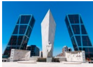
Puerta de Europa

De 'Poort naar Europa' (1996) is een moderne versie van een triomfboog. De hellende torens van glas en metaal tellen 26 verdiepingen.