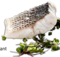
Visgerecht bij La Manduca de Azagra

Dit Navarrese restaurant met avant-gardistisch interieur staat bekend om zijn heerlijke groenten, verse vis en lamsrack. Tapas eet u aan de bar.