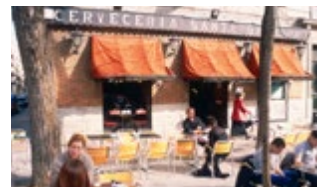
Cervecería Santa Bárbara

Grote moderne bar met bier van de tap, populair bij kantoorpersoneel. Ruime keuze uit diverse tapas (blz. 67).