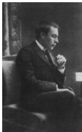
Sergej Rachmaninov in 1904