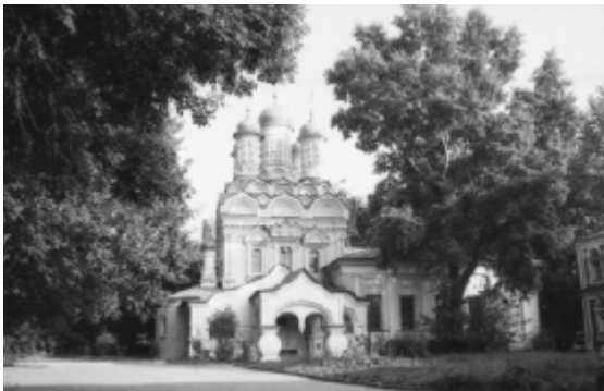
De Kerk van Sint-Nicolaas de Wonderdoener

Vooraan stonden de vrouwen van de kooplieden, met hun ruisende zijden rokken en blouses, die een kruis sloegen met hun mollige roze vingers, terwijl hun echtgenoten naast hen ernstig en verwoed baden. Daarachter zag je de mensen die afhankelijk van de huishouding waren en arme verwanten: oude vrouwen in het zwart, godsvruchtige roddelaarsters, koppelaarsters, hoeders van de familiehaard, tantes met nichten die nog steeds hoopten op een bruidegom en bezwijmden van het vet en het verlangen, vertrouwelingen en huismeiden. De regeringsfunctionarissen en hun echtgenotes stonden vlakbij in hun modieuze kledij. Helemaal achterin, dicht opeen als ze stonden of knielden, waren de uitgeputte arbeiders, wachtend op troost en verlossing van de barmhartige God, onze Verlosser. Maar de Verlosser zweeg terwijl hij bedroefd omlaagkeek naar de gekromde lichamen en gebogen ruggen... Een beetje nerveus schertsend en lachend spuugden jonge jongens en meisjes op hun vingertoppen en probeerden elkaars kaars te doven. Ze