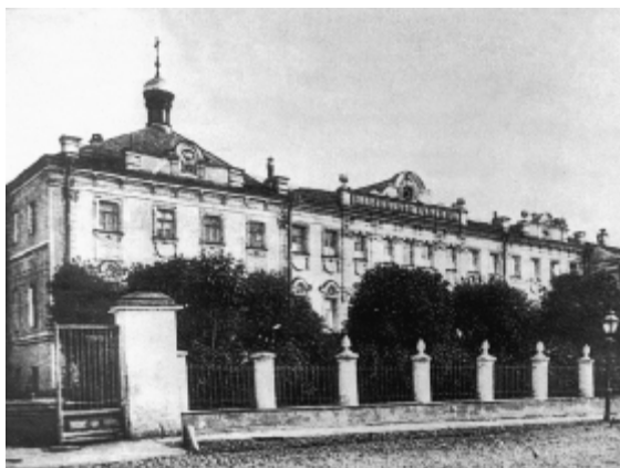
Maria Middelbare Meisjesschool

Achter de school bevond zich de grote metaalfabriek van Gustav List, die meer dan duizend arbeiders in dienst had en onder andere stoommachines, brandkranen en waterleidingen produceerde. Gustav List zelf woonde boven het kantoor van de fabriek in een groot appartement met een wintertuin. Hij was in 1856 vanuit Duitsland hierheen gekomen, werd aangenomen als werktuigkundige in de suikerfabriek van Voronezj, begon zijn eigen fabriek in Moskou in 1863 en zette die om in een maatschappij op aandelen in 1897. 11