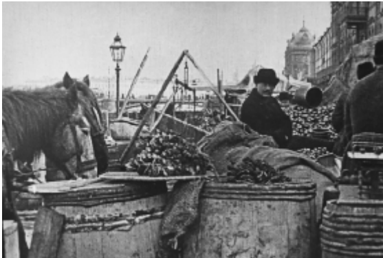
Paddestoelenmarkt bij de Grote Stenen Brug

rollers actief, die proberen ergens een stormloop te creëren. 78