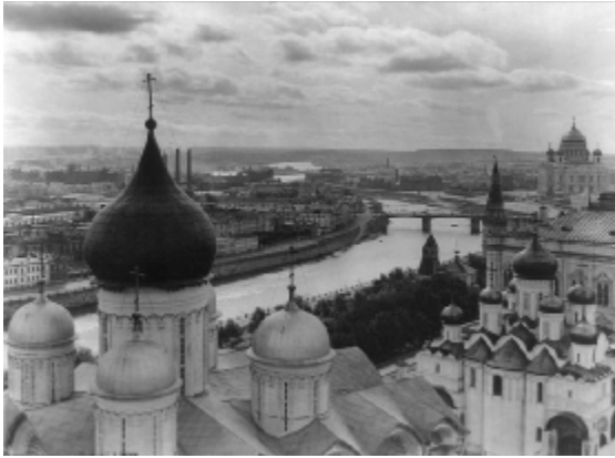
Het Moeras gezien vanaf het Kremlin. De Christus-Verlosserkathedraal is rechts op de achtergrond te zien.