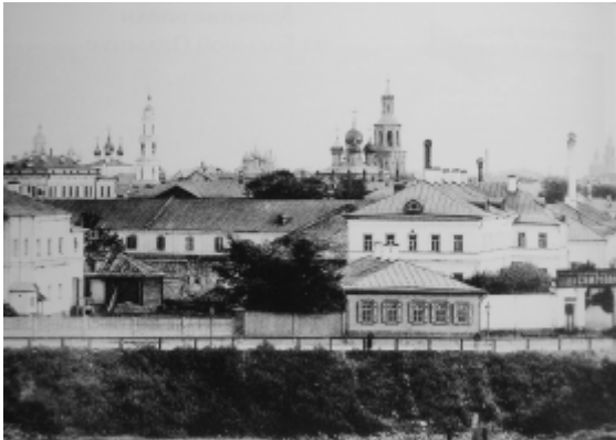
De zuidzijde van de Moskva gezien vanaf de Greppel

wanneer het omliggende gebied de grootste ‘paddestoelenmarkt’ van de stad werd. Volgens de krantenberichten domineerden hier de champignons – gedroogd of ingelegd – maar er waren ook ‘bergen broodjes en witte radijnen’, ‘volop honing, jam, goedkope zoetigheden, en zakken gedroogde vruchten’ en ‘lange rijen kraampjes met vaatwerk, goedkope meubels en allerlei eenvoudige huishoudelijke artikelen’. Je kon er ‘het geschreeuw, gelach, gefluit en de niet zo vastenachtige grapjes’ horen ‘van duizenden mensen, van wie velen nog steeds een kater hadden van het feest op Vastenavond’. ‘De mensen waden door een modderige brij, maar dat schijnt niemand te deren. Grappenmakers stampen in waterplassen om de vrouwen met vuil water te bespatten. Er zijn ook nogal wat zakken-