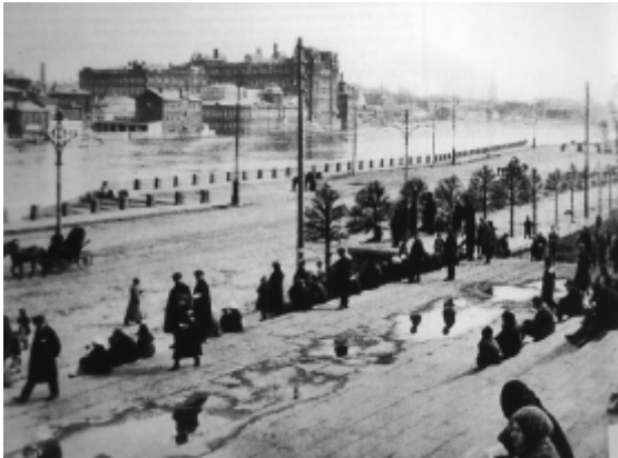
Gezicht op de fabriek van Einem, gezien vanaf de Christus-Verlosserkathedraal

en boven, een serre en een grote stal. Aan de overkant van de binnenplaats waren appartementen voor de fabrieksingenieurs (overwegend Duitsers), doktersassistenten, gehuwde en ongehuwde werknemers, huishoudsters en voerlui, en verder een bibliotheek, een wasserij, diverse slaapzalen en kantines voor de arbeiders. De fabriek stond bekend om de hoge lonen, goede werkomstandigheden, het amateurtheater en een actief door de politie gesteund wederzijds hulpfonds. De zondagse lunch omvatte ook een glas wodka of een halve fles bier; pensioengasten die jonger dan zestien waren, kregen gratis kleding, zongen in een koor, werkten in het pakhuis (ongeveer elf uur per dag) en moesten om acht uur 's avonds binnen zijn. Ongeveer de helft van de arbeiders zat daar meer