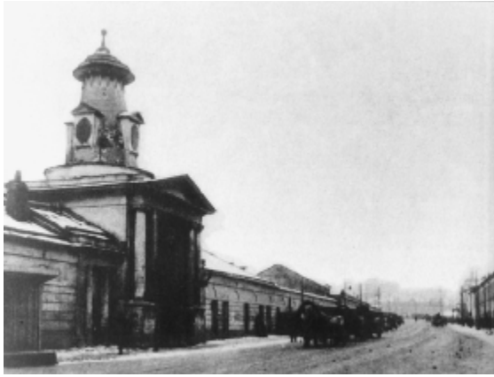
Ingang van het Wijn- en Zoutterrein