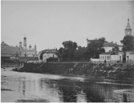
De Bersenjev-kade gezien vanaf de dam