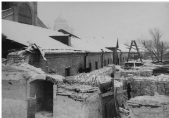
Huis naast de Energiecentrale