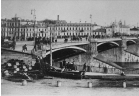
De Grote Stenen Brug