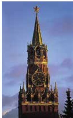
De Verlosserstoren, vroeger de hoofdingang van het Kremlin

De Verlosserstoren, die 70 m uitrijst boven het Rode Plein, is genoemd naar een icoon van Christus, die in 1648 boven de poort is geplaatst. De poort is niet meer geopend voor publiek, maar vroeger was hij de hoofdingang van