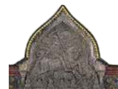
Tretjakovgalerij Blz. 120–123.