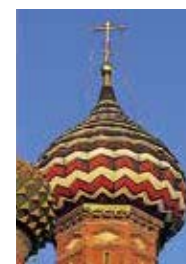
Basiliuskathedraal Blz. 110–111.