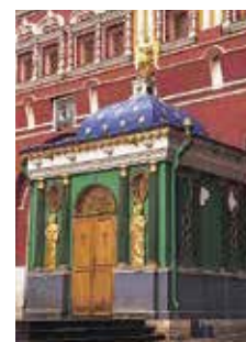
Rode Plein Blz. 108.