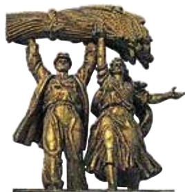
Socialistisch-realistisch beeld van Sovjetboeren in het Russisch Tentoonstellingscentrum (blz. 147)