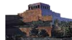
Leninmausoleum Blz. 109.