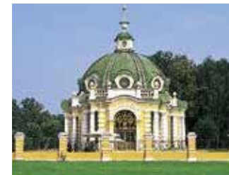
Koeskovo Blz. 144–145.

◀ De Basiliuskathedraal op het Rode Plein, met zijn kleurige uivormige koepels