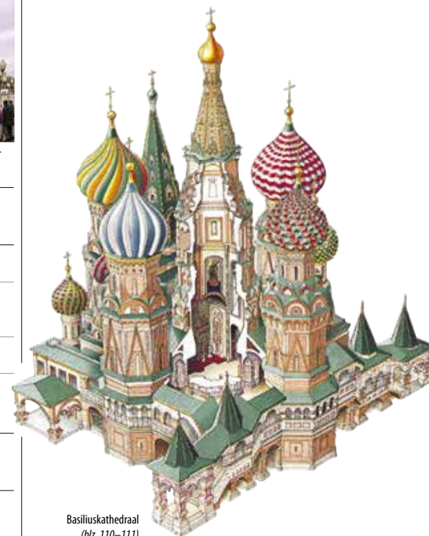
Basiliekathedraal (blz. 110–111)