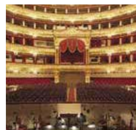
Bolsjojtheater Blz. 92–93.