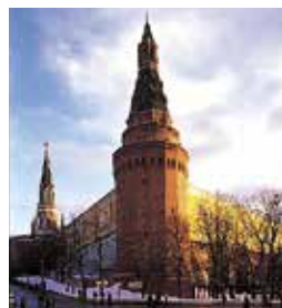
Hoekarsenaalstoren met Arsenaal en St.-Nicolaastoren