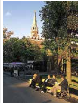
Deel van het Alexanderpark, met achteraan de Drievuldigheidstoren

Voor de middelste Arsenaaltoren in het noordelijke deel van het park is in 1913 een