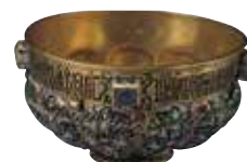
Wapenkamer Blz. 66–67.