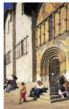
Maria-Hemelvaartkathedraal Blz. 60–61.