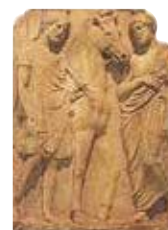
Poesjkinmuseum voor Beeldende Kunst Blz. 80–83.