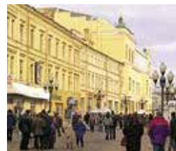
De Oelitsa Arbat – een populaire winkel- straat met veel restaurants (blz. 72)