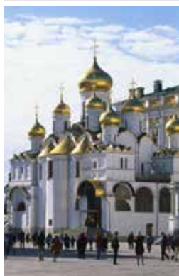
De Maria-Hemelvaartkathedraal in het Kremlin (blz. 62)