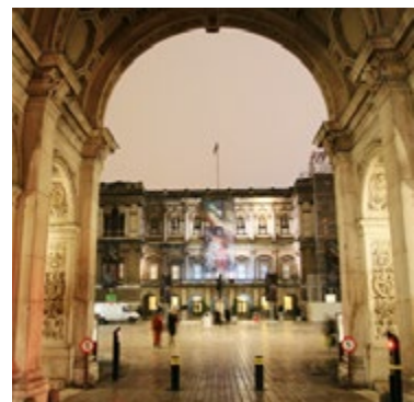
The Royal Academy of Arts

In Burlington House, de belangrijkste Britse kunstacademie, zijn grote tentoonstellingen te zien. Het is een van de laatste 17de-eeuwse herenhuisen in de buurt en aan de voorzijde ziet u de vroegere tuin. Bij de ingang ziet u Madonna met kind (1505), een van de vier sculpturen ter wereld van Michelangelo buiten