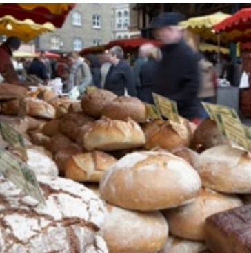
Ambachtelijk brood, Borough Market

De oudste markt van Londen, naast Southwark Cathedral, is ook een van de sfeervolste. U vindt er tegenwoordig ruim 100 kraampjes met topproducten uit het hele land,