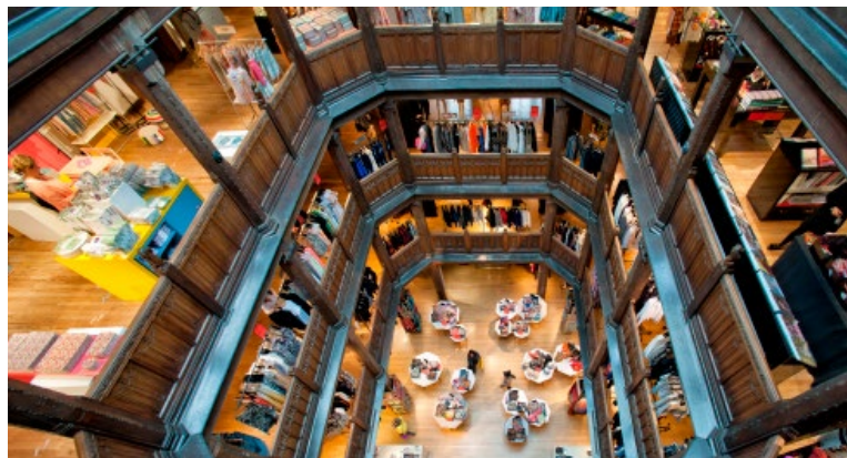
Het schitterende warenhuis Liberty

Prachtig winkelpand uit 1925 met houten vloeren en lambriseringen. De inrichting van Liberty is even exclusief als de artikelen die er te koop zijn. Ontwerpers als William Morris waren in dienst van deze winkel, die geruime tijd verbonden was aan de Arts and Craftsbeweging. Eigen collectie textiel met bloemmotief, woninginrichting, dames- en herenmode, en geschenken (blz. 98).