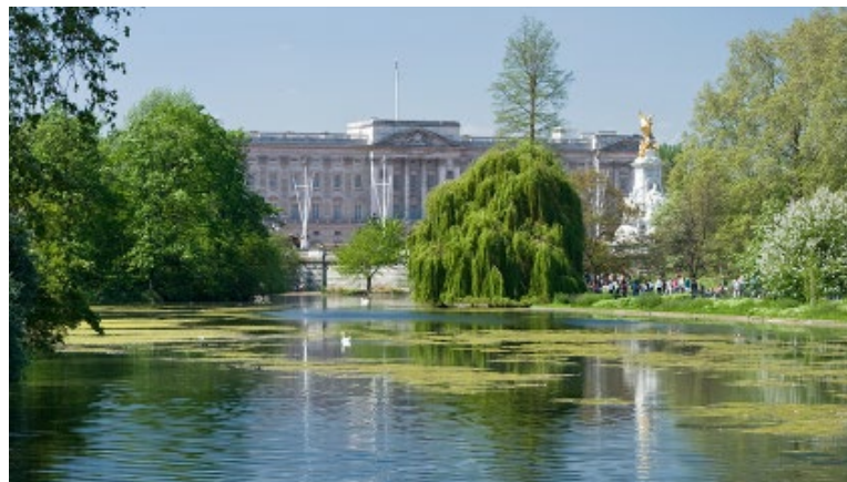
Buckingham Palace gezien vanuit St James's Park

Dit paleis werd gebouwd door Hendrik VIII op de plek waar vroeger het St Jamesziekenhuis stond. De Tudorpoort van rode baksteen maakt het paleis tot een opvallend, herkenbaar gebouw (blz. 54).